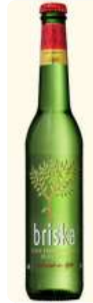
Finns olika smaker