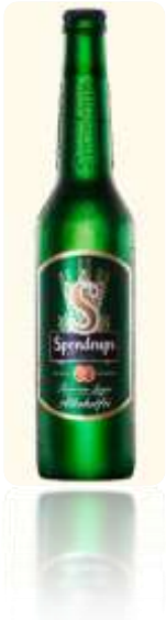
50:- (Mellan öl)