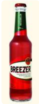
Finns olika smaker