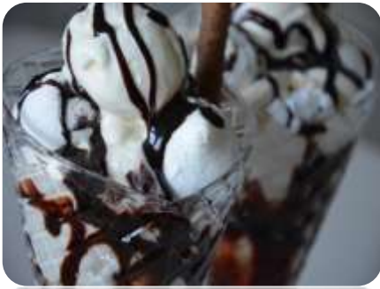
Glass med maräng 69:-