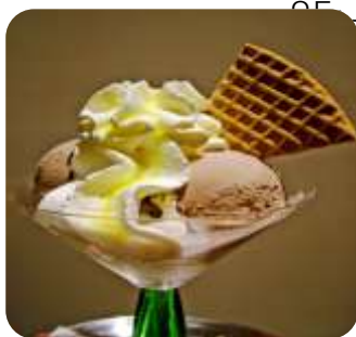
Äkta italiensk glass gelato 79:- (Fråga veckans smak)