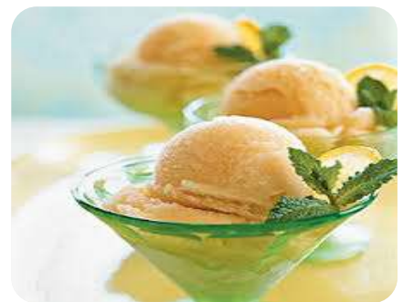
Hallon & Mango