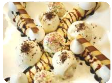
Glass med maräng/Bananasplitt för 2 102:-