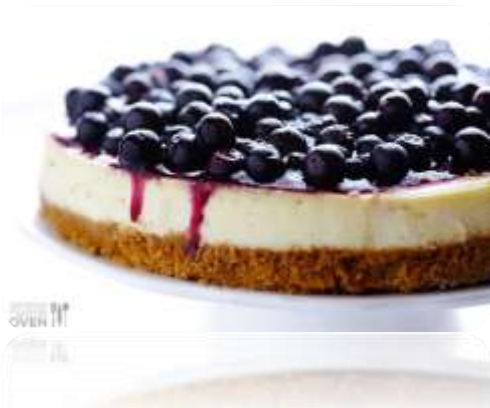
Cheesecake med vaniljglass (fråga veckans smak)